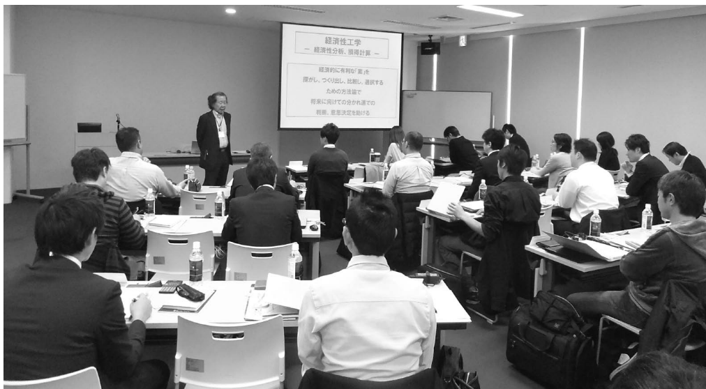
第49回セミナー風景