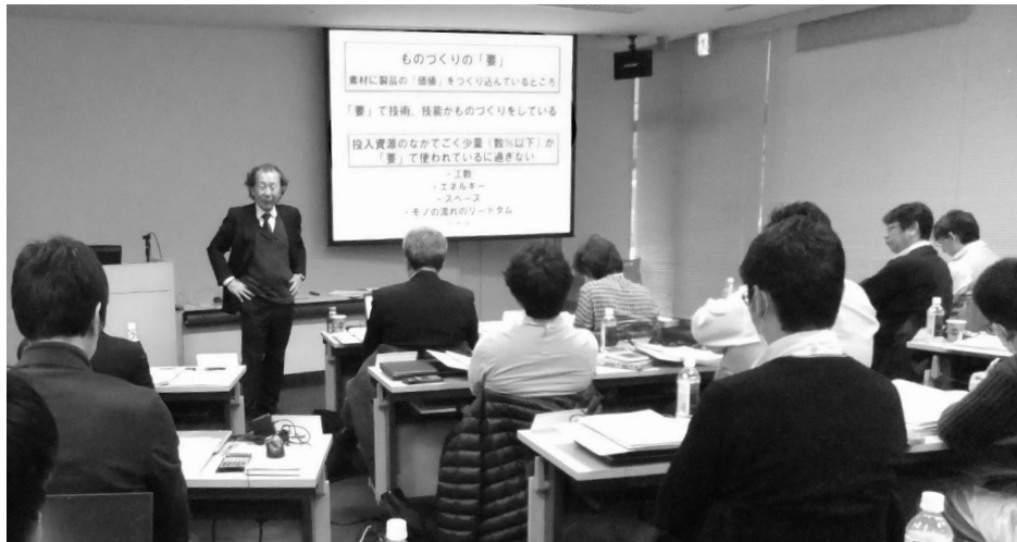
第50回セミナー風景