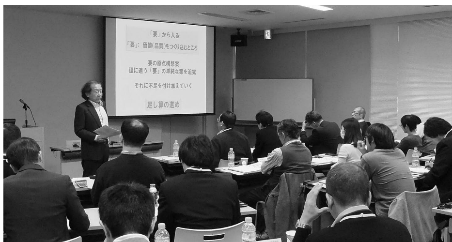
第51回セミナー風景